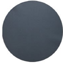
Rhaco Grit : กระดาษทรายขนาดความละเอียด

P120, P180, P220, P320, P500, P600, P800, P1000, P1200, P2400, P4000