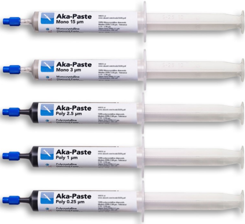
Aka-Paste (อาคา-เพสต์)