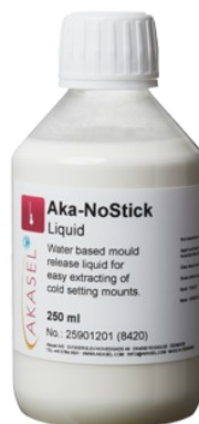
Aka-NoStick Liquid (อาคา-โนสติก ลิกวิด)

ผงเคลือบลงบนโมลด์ เพื่อป้องกันการยึดติด ระหว่างเรซินกับโมลด์ ซึ่งทำให้ยากกับการนำ ชิ้นงานที่ขึ้นเรื่อนด้วยเรซินแล้วออกจากโมลด์