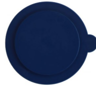
Silicone Lid (ซิลิโคน ลิด)

โมลด์สำหรับเรซินทุกชนิดในการขึ้น เรื่อนชิ้นงานแบบ Cold Mounting