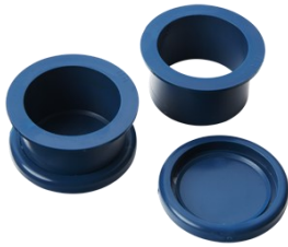
Aka-Moulds (อาคา-โมลด์)

โมลด์สำหรับเรซินทุกชนิดในการขึ้น เรื่อนชิ้นงานแบบ Cold Mounting