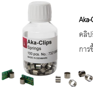
Aka-Clip Stainless Steel (อาคา-คลิป สแตนเลส สตีล)

ฝาครอบแม่แบบ ทำจากซิลิโคน ใช้งานร่วมกับ Aka-Moulds ทำให้สามารถถอด ชิ้นงานจากแม่แบบได้ง่าย