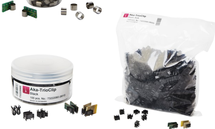
Aka-TrioClip Black (อาคา-ทรีโอคลิป)

คลิปยึดจับชิ้นงาน ทำด้วย stainless steel ช่วยให้ง่ายต่อการจับวางชิ้นงานในตำแหน่งที่ต้องการก่อน การขึ้นเรื่อนชิ้นงานด้วยเรซิน เป็นแบบสปริง