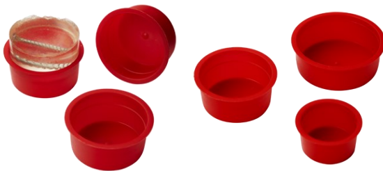
Protection Caps (โปรเทคชั่น แค็บ)

ช่วยให้ง่ายต่อการจับวางชิ้นงานในตำแหน่งที่ต้องการก่อนการ ขึ้นเรื่อนชิ้นงานด้วยเรซิน สามารถจับชิ้นงานได้คลิปละ 3 ชิ้นงาน แบบ 3 ขา เพื่อลดจุดล้มเหลวในระหว่างการขัด ทำให้ลดอัตราการ ปนเปื้อนและรักษาขอบชิ้นงาน