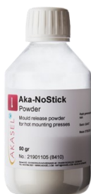
Aka-NoStick Powder (อาคา-โนสติก เพาเดอร์)

ฝาครอบชิ้นงาน ใช้สำหรับป้องกันสภาพพื้นผิวชิ้นงานหลังการขัดผิว เสร็จสิ้น เพื่อป้องกันปัญหารอยขีดข่วนและความเสียหายอื่นๆ ที่อาจ เกิดขึ้นกับผิวชิ้นงาน